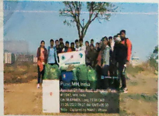
Civil engineering students displaying the Environmental club.