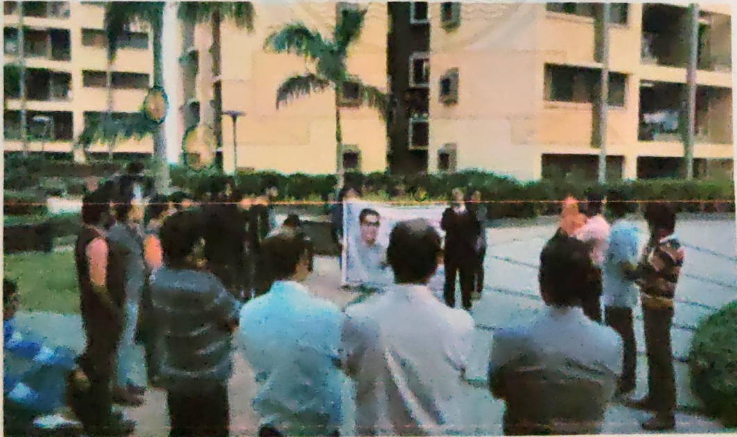
Civil engineering department spreading the awareness on Garbage segregation at source